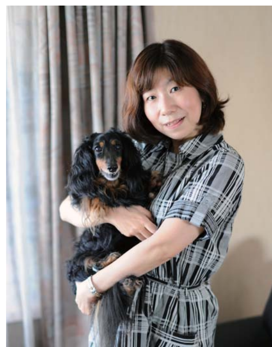
テープ起こしのKIT(キット)

——これから起業される方に先人としてメッセージを一言。 安原 人には向き不向きがあるので、起業がベストとはいえない。ただ、今もし起業しようかどうか迷っている方がいたら、あまり考え過ぎないで、後ろ向きなことばかり考えているといつまでたっても前へ