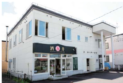
105年の歴史あるクリーニング店として、現在は豊岡に店舗を構えている。